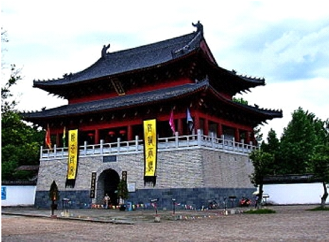
Вход во Дворец Высшей Чистоты - Ворота Фуди (Счастливой Земли)