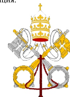
Герб Папского престола