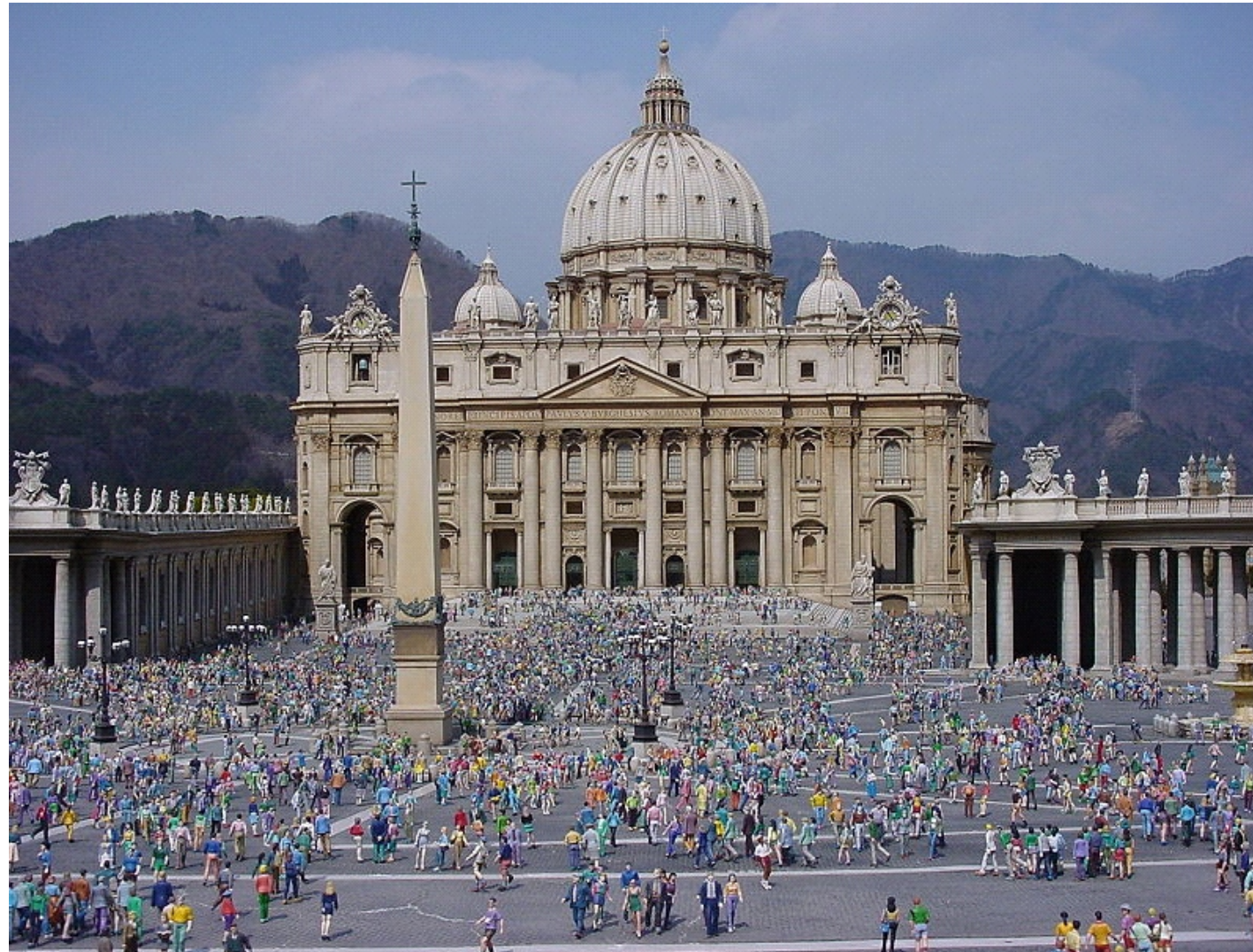
Собор Святого Петра — католический собор, Рим

Католицизм или католициество (всемирный; впервые по отношению к церкви термин применён около 110 г. и закреплён в Никейском символе веры) — крупнейшая по числу прихожан (более 1 млрд) ветвь христианства.